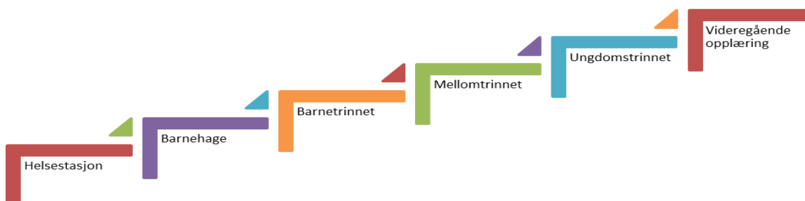
Figur 7-1:Foreldresamarbeid i Sel

Foreldrene skal oppleve at de er viktige og verdifulle i eget barns/ungdoms læring, og planen skal fungere som et overordna verktøy for alle som arbeider med barn og unge i Sel kommune. En felles gjennomgående plan skal sikre at alle foreldre i sitt samarbeid med ulike virksomheter skal kjenne igjen hvilke verdigrunnlag Sel kommune har i sitt tjenesteområde. Tiltakene handler om at virksomhetene som vist på Figur 7-1 skal henge sammen og ha systematikk i sitt samarbeid med foreldre.