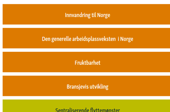
Figur 2.

For å utvikle Selssamfunnet, og skape grunnlag for gode velferdstjenester, trengs det både