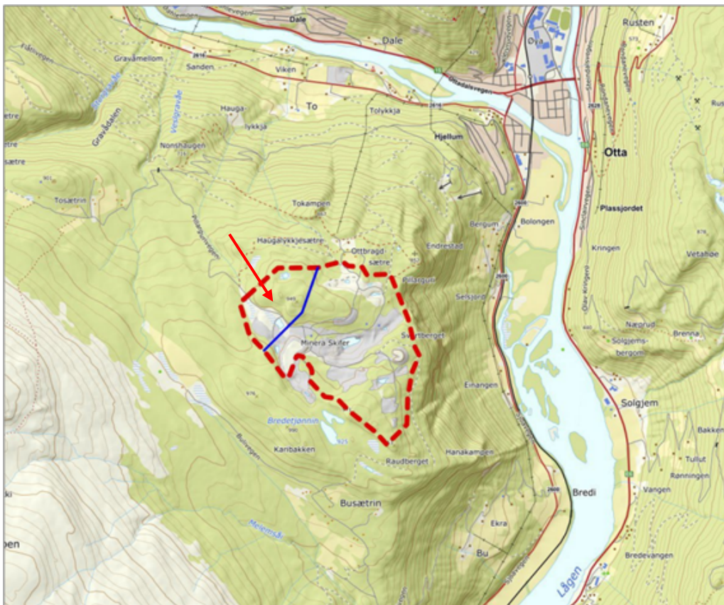
Figur 1: Planområdet for Pillarguribrota vist med rød stiplest strek. Utvidelse av planområdet ligger nordvest for blå linje.