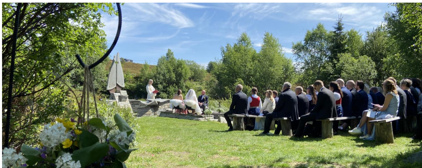
Vigsel på Høvringen fjellalter